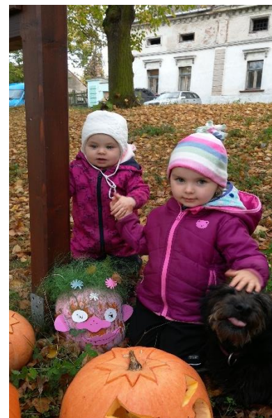
Halloweenské tvoření a průvod dětí