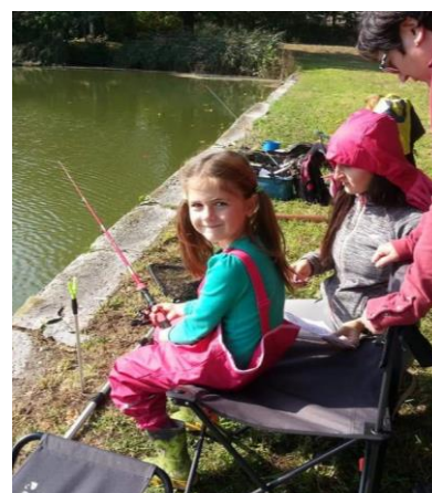
Rybářské závody "O Hořanskou čudlu"