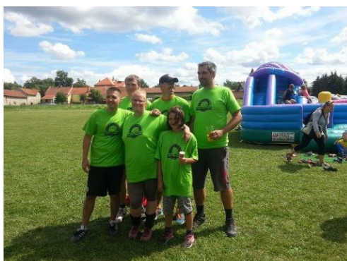
56. volejbalový turnaj a hořanské družstvo