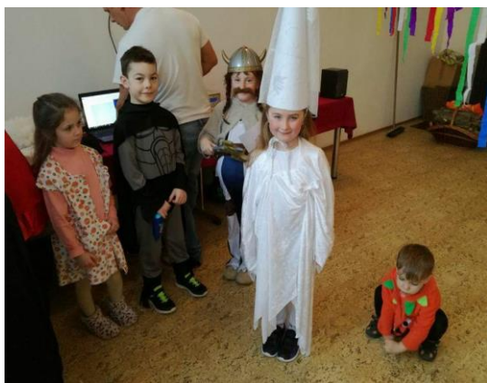
Dětský masopustní karneval