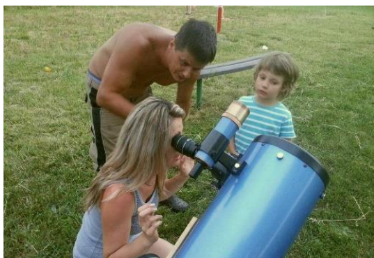
Pozorování Měsíce na Dětském dni

Děkujeme všem, kteří se na společných akcích podíleli a těšíme se na vás i v roce 2018!