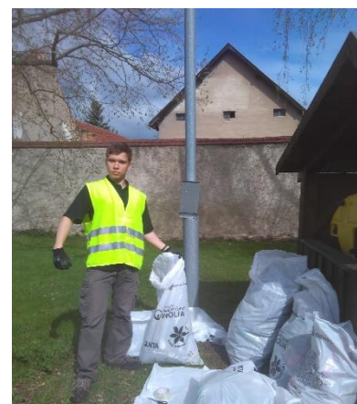
Jarní úklid obce "Uklidme svět – Uklidme Česko"